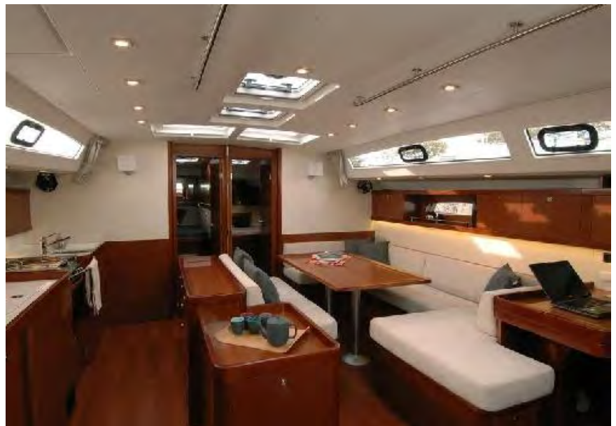
Oceanis 48 -veneiden tiloja

Esimerkiksi neljän kajuutan veneeseen otamme vain 6 asiakasta, jolloin kaikille on veneessä riittävästi tilaa asumiseen ja yksityisyyteen.